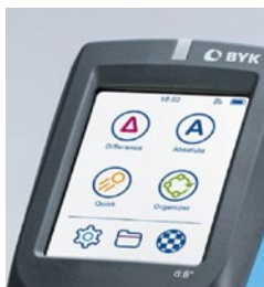
Fot. 4. Kolorowy wyświetlacz z intuicyjnym menu.

Do pomiaru barwy urządzenie wykorzystuje białe LED-y i iluminatora polichromatycznego. Wzbudzenie fluorescencji natomiast odbywa się za pomocą kolejnych dwunastu monochromatycznych źródeł LED obejmujących zakres od 360 do 660 nm. Detekcja dokonywana jest w zakresie spektralnym 360 do 760 nm i krzywe