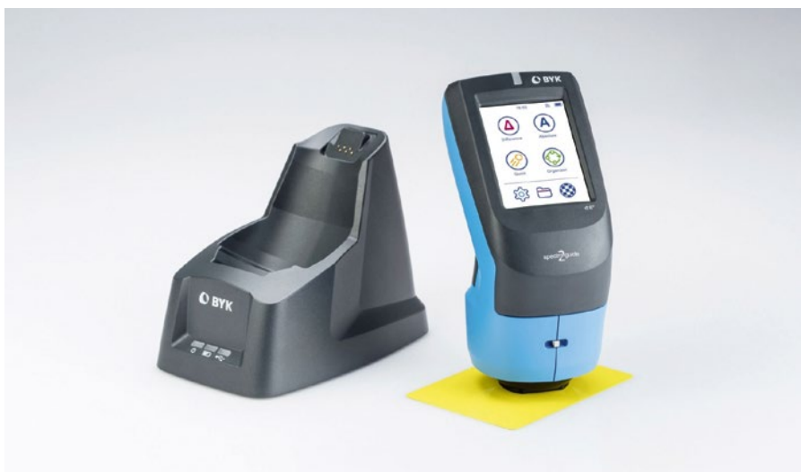
Fot. 1. Spektrofotometr spectro2guide ze stacją dokującą.

W minionym roku niemiecki producent sprzętu pomiarowego BYK Gardner GmbH stworzył i zaprezentował nową generację spektrofotometrów z serii spectro-guide. Nowy model – spectro2guide stanowi połączenie trzech urządzeń pomiarowych: spektrofotometru barwy, połyskomierza oraz fluorymetru (fot. 1).