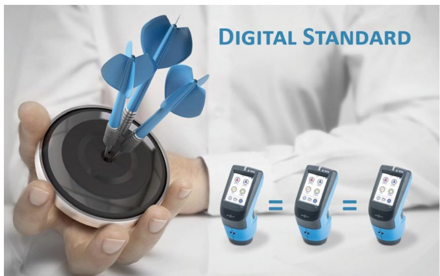
Fot. 3. Zgodność międzyprzrządowa spectro2guide i standard cyfrowy.