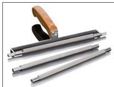
uchwyt aplikatora - 2440