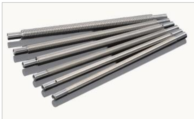
4101 statyw - 10"

Wymiary każdego z aplikatorów są następujące: ½ cala średnicy oraz 12 cali długości. Przybliżona grubość powłoki po przejściu farby przez szczeliny aplikatora oraz ujednoczeniu powierzchni została obliczona dla każdej średnicy i umieszczona w tabeli.