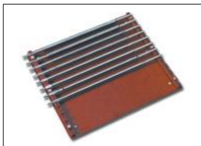
4102 –statyw – 24 cm